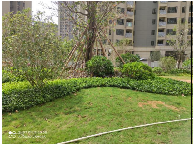
2020.9 项目区道路两侧绿化