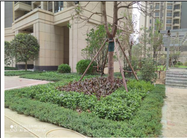
2020.9 项目区道路两侧绿化